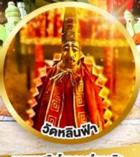
วัดลีนฟ้า

ขอพรเรื่องการศึกษา, การงาน สติปัญญาและความกล้าหาญ