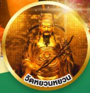
วัดหยวนหยวน

ขอพรเรื่องสุขภาพ, โชคลาภ ความเจริญก้าวหน้า