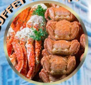
SAPPORO SNOW FESTIVAL 2027