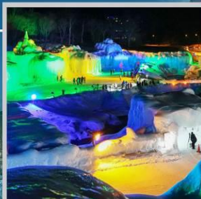
“SOUNKYO ICE FEST”