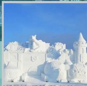
“ASAHIKAWA SNOW FEST”