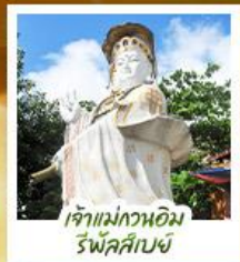
เจ้าแม่กวนอิม รีฟลัสส์บีย์