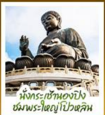
นั่งกระเช้ามองปิง ชมพระใหญ่ไถ่หุ้ย

นั่งกระเช้ามองปิงสักการะพระใหญ่ไถ่หุ้ย • วัดหวังต้าเซียน ขอพรสุขภาพ ความรัก วัดเขกงหมิว ขอพรองค์เขกง โชคลาภ การเงิน และธุรกิจ • เทพเจ้ากวนไท ความซื่อสัตย์ เงินทอง ธุรกิจมั่นคง • เจ้าแม่กวนอิมรีฟลัสส์บีย์ รับพลังงานดี เสริมพลังฮวงจุ้ยที่รีฟลัสส์บีย์