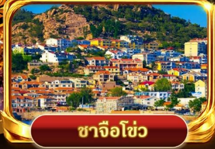
ซาจิวโซ่ว