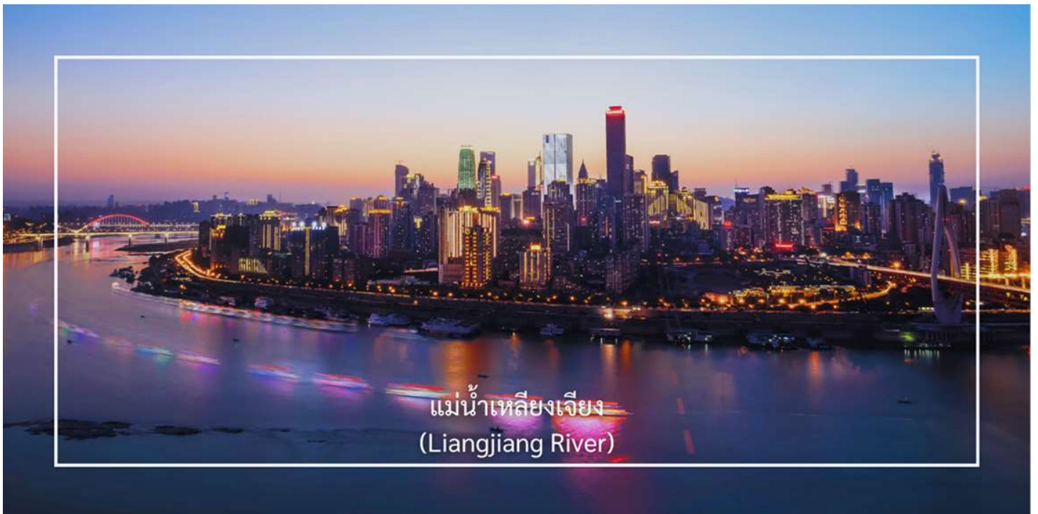
แม่น้ำเหลียงเจียง (Liangjiang River)

ล่องเรือแม่น้ำเหลียงเจียง (Liangjiang Cruise) พื้นที่จุดบรรจบของแม่น้ำทั้งสอง ซึ่งเป็นหนึ่งในมุมมองที่สวยงามที่สุดของเมืองฉงชิ่ง ซึ่งประกอบด้วย แม่น้ำแยงซี (Yangtze River) เป็นแม่น้ำสายที่ยาวที่สุดในจีน และเป็นสายหลัก แม่น้ำเจียงหลิง (Jialing River) แม่น้ำสาขาที่สำคัญซึ่งไหลลงสู่แม่น้ำแยงซี พื้นที่ที่แม่น้ำทั้งสองสายนี้มาบรรจบกันมีชื่อว่า “เหลียงเจียง” กิจกรรมล่องเรือสองแม่น้ำ (Two Rivers Cruise) ซึ่งได้รับความนิยม เพราะจะได้ชมเส้นขอบฟ้าของฉงชิ่งยามค่ำ คิน ดิกระฟ้า แสงไฟเมือง เป็นเอกลักษณ์