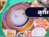
ชาบู แซลม่อน