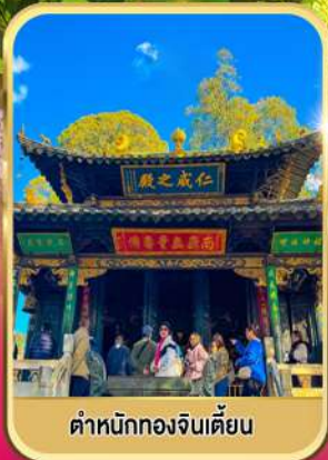
ตำหนักทองจีนเตียน