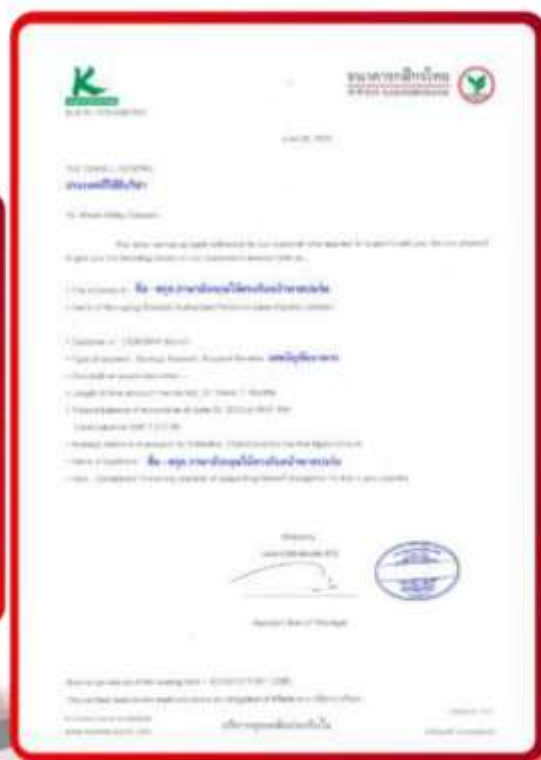
ตัวอย่าง Bank Guarantee ที่ผู้สมัครต้องขอเกี่ยวกับธนาคาร