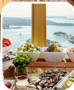
SKYFEAST BUFFET SYDNEY TOWER