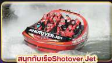
สนุกกับเรือ Shotover Jet