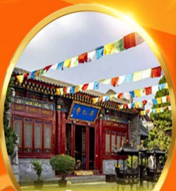
วัดกวางเหริน