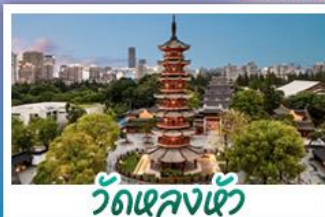
วัดเลงเซ้ง