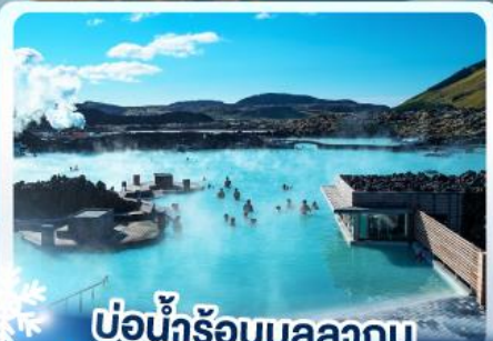
♨️ แช่น้ำร้อนบลูลากูน

เก็บไอซ์แลนด์ แดนภูเขาไฟคิรูกูฟลา และ แช่น้ำร้อนบลูลากูน