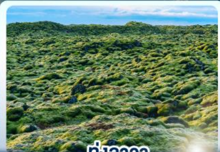
🌿 ทุ่งลาวา