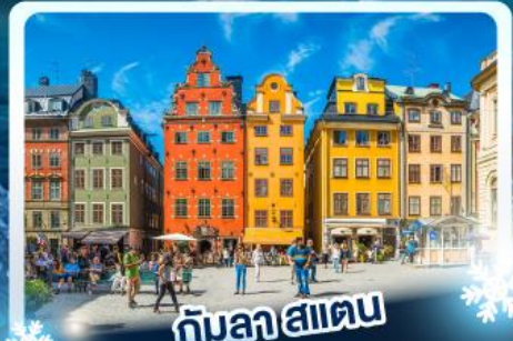
🏘️ กับลาฮาน