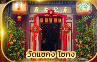
วัดเขากง ไชกง