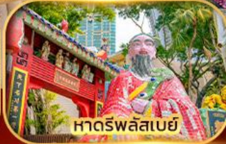
หาดรพลัสเบย์