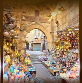
ตลาดฮานเวลกาลลี