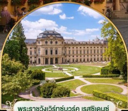
พระราชวังแวร์ซายส์ ฝรั่งเศส