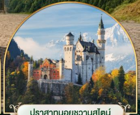
ปราสาทนอยชวานสไตน์ เยอรมนี