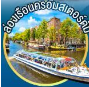
ล่องเรือนครอัมสเตอร์ดัม