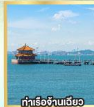
กำเรือจันทันเฉียว