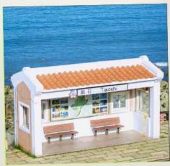
Tiaoshi Bus Station