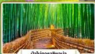
ป่าไผ่อาราชิม่า

เที่ยวโตชิราคาวาโกะ ทาคายาม่า | 5 วัน 3 คืน