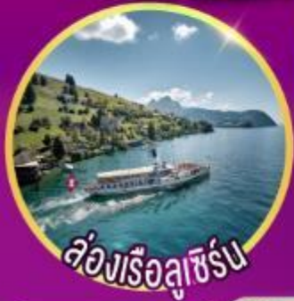
ล่องเรือลูซิิร์น