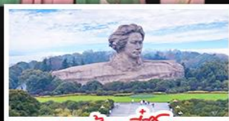
เกาะส้มจวีจี้โจว