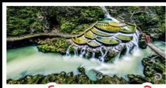
แกรนด์แคนยอนหลงเหมิน

เช่าผ่านจิ้ง - เมืองโบราณฟูหรงเจิน เมืองโบราณเฟิงหวาง - เกาะส้มจวีจี้โจว แกรนด์แคนยอนหลงเหมิน - ไม้เท้าร้านช้อป พักโรงแรม 5 ดาว - รถไฟความเร็วสูง