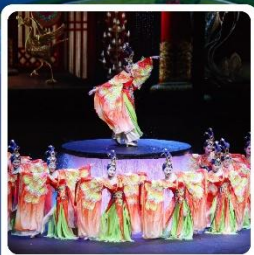
โชว์ FOSHAN QIANGUING