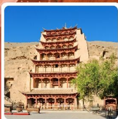
ถ้ำมั่วเกาตุ

ไฮไลท์! ถ้ำมั่วเกาตุ ถ้ำพุทธศิลป์โบราณ มรดกโลก UNESCO ภูเขาสายรุ้งจางเย่ ภูเขาหินสีสันแปลกตา หนึ่งในภูมิประเทศที่แปลกที่สุดในโลก