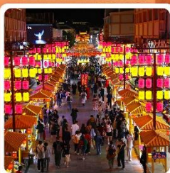
ตลาดกลางคีนซาโจว