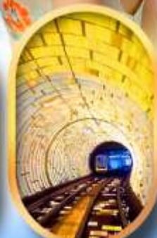
อุโมงค์แม่เหล็ก