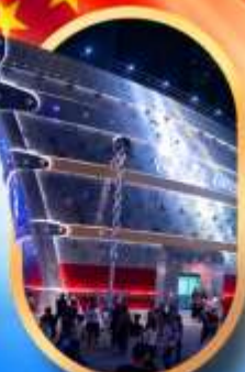
เรือคองคอลลี