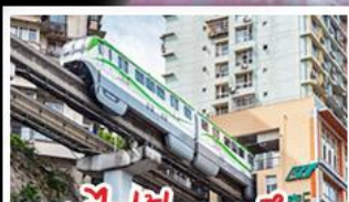
รถไฟฟ้าทะเลตุ๊ก