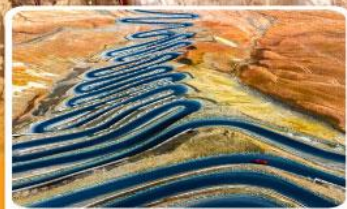
ถนนผานหลงกู่ต้าอว