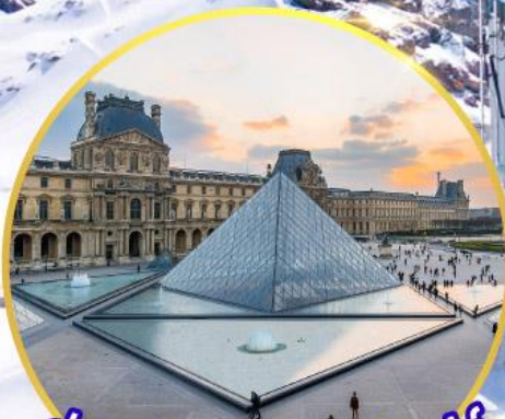
ถ่ายรูปคู่พีพีร์กันที่ลูฟร์