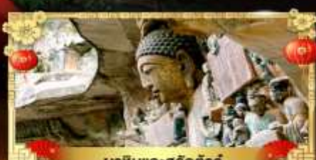
นาหินแกะสลักต้าจู่