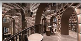
ร้านหนังสือจงซูเทอ

อุทยานภูเขาสี่ดรุณี อุทยานป่าเขิงโกว หมู่แพนด้าอนแซลพี ร้านหนังสือจงซูเทอ วัดต้าฉือ ถนนโบราณความจำ ซ้อปิ้งย่านคิง ถนนไท่กู่หลี่ + ถนนซุนซื่อ เมนูพิเศษ สุกี้หมาล่าเสวณ