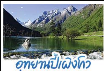
อุทยานปักธงโกว

ภูเขาสัปดาห์นี้ อุทยานจิวจ้ายโกว นั่งรถไฟความเร็วสูง น้ำพุไม่ใฝ่ตึกSKP อุทยานปักธงโกว วัดต้าฉือ ถนนโบราณชอยกวางชอยแคบ ช้อปปิ้งถนนไถ่กู่หลี่ + ถนนซุนซี้