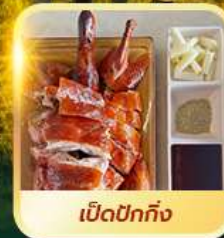
เปิดปอกกิ้ง