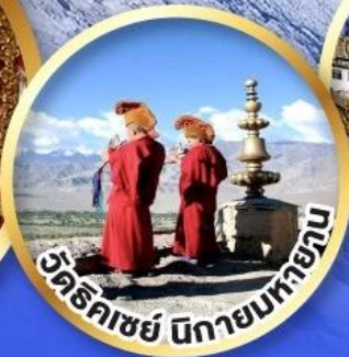
วัดริคเชย์ นิกายมหายาน