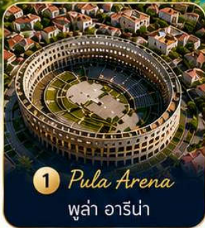
1 Pula Arena ปูลา อาร์น่า