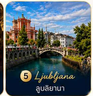
5 Ljubljana ลูบลิยานา