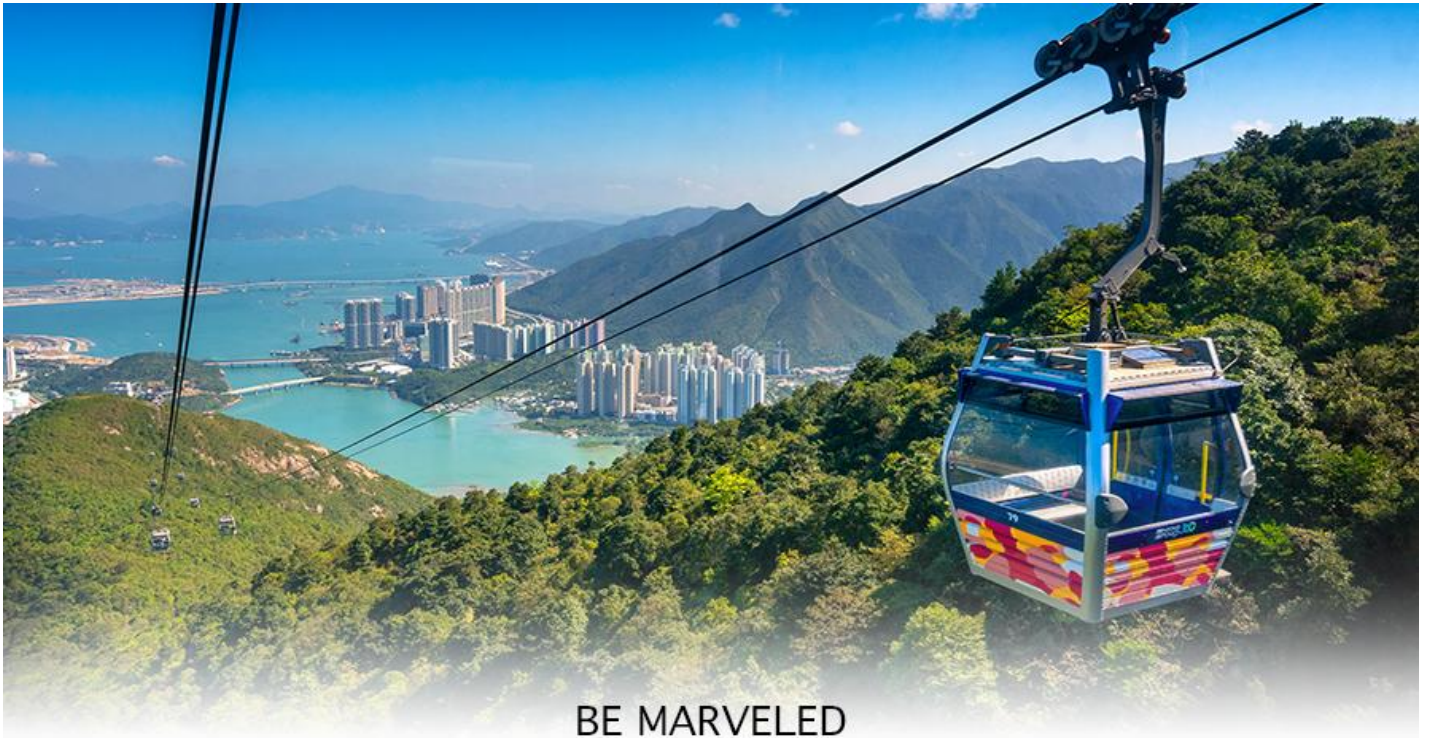
BE MARVELED กระเช้ามองปีง

ของอุทยานบนเกาะลันเตาเหนือ ถือได้ว่าเป็นแหล่งท่องเที่ยวอันมีเอกลักษณ์ระดับโลกของฮ่องกง (**กรณี กระเช้ามองปีง 360 มีการปิดซ่อมบำรุง หรือ มีการปิดเนื่องจากสภาพอากาศแปรปรวน ทางบริษัทฯ ขอสงวน สิทธิ์ในการเปลี่ยนเป็นใช้รถโค้ชของทางอุทยานในการเดินทาง เพื่อนำท่านขึ้นสู่หมู่บ้านวัฒนธรรมมองปีง บน เกาะลันเตาแทน**) จากนั้นนำท่านไปสักการะ (พระใหญ่เกาะลันเตา หรือ พระพุทธรูปเทียนถาน (TIAN TAN BUDDHA STATUE))