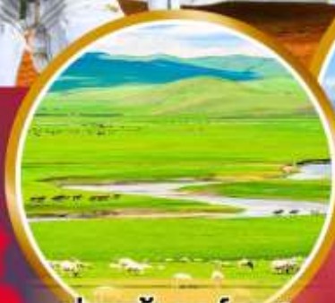
ทุ่งหญ้าออร์โดส

พิเศษ!!! สอบชุดของโทเลีย บนกระโหลบของโทเลีย