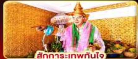
สิทธิการะเทพทันใจ